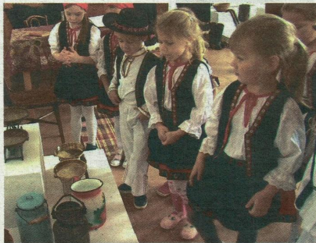
Múzeum si boli obzrieť aj deti z materskej školy

O pani Fodorovej: Tempo. Ročník LXXVII, číslo 21 / r. 2016